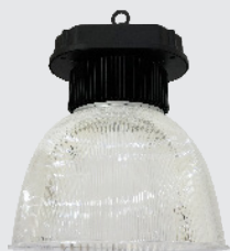
Modell mit Transparent-Schirm