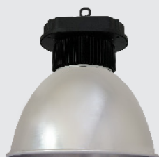
Modell mit Glocken-Schirm