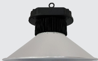
Modell mit Dreieck-Schirm